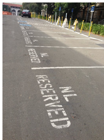
保留給諾貝爾獎得主的車位

有了這兩次尋找遠哲的經驗讓我對柏克萊更加的熟悉，也使得這趟旅程更加精采。雖然在專業上遠遠不及李遠哲先生和其他的諾貝爾獎得主，不過可以想像著這些科學家當時的研究環境