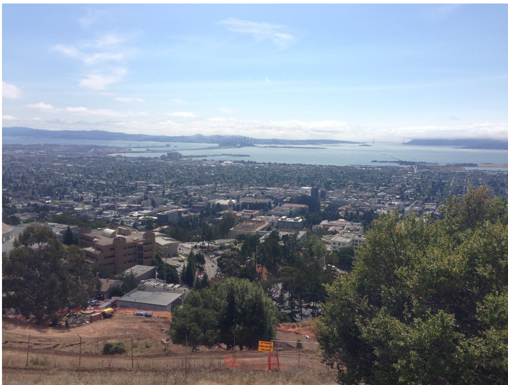
從山上俯瞰柏克萊校園及著名的鐘塔(圖正中)

明明說可以到啊！看來 Google Maps 路徑上的指示不可盡信。警衛告訴我們上面有一個勞倫斯的科博館可以上去看看，所以我們仍不放棄，即使已經滿身大汗。沿著山路我們愈爬愈高，從原本可以看到整個勞倫斯實驗室到可以看到整個柏克萊，包括 international house 和柏克萊校園以及校園中著名的鐘塔，當然免不了在這拍拍照、看看風景。這時大約已是下午四點鐘，陽光依舊強大，我們有種快要中暑的感覺，於是在這眺望著遠方霧氣茫茫的舊金山，搶按幾下快門，留了影便決定往回走了。