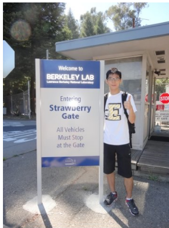
勞倫斯實驗室大門口