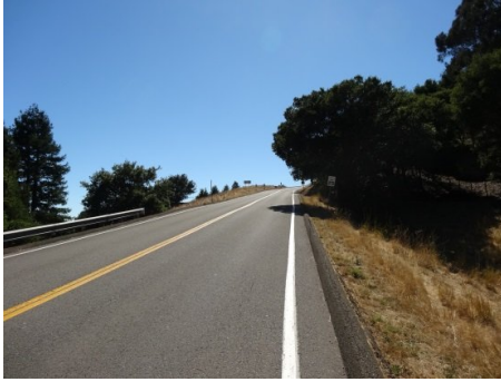
長直寬闊的一段上坡