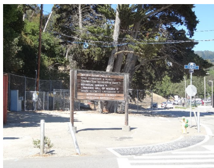
要進入柏克萊山的入口處

一路上我們有說有笑、瀏覽沿途風景，先是經過一個小球場、游泳池，當時午後的天氣蠻炎熱的，真想跳下去玩玩水！我們邊聊天，邊拍照記錄著尋找遠哲之旅，沿著人行道走了會，停下來休息一下，也看看 Google Maps。咦！我們走到哪裡了？想不到就在剛剛還在聊天時，我們已經錯過了一個要往左轉的岔路，而且大概超出了兩百公尺了。於是趕緊調頭，來到了一個鐵門前，對照了一下 Google Maps 的位置，這才找到，但是 - 鐵門是關的。看了旁邊的招牌，才知道這條路是管制的……，無奈的我們，只好又回原路走上去，並且重設 Google Maps 的路徑，想不到現在變成要四十多分鐘才能到了。但既然都走到這了，抱著不達目標不停止的決心努力往上爬，就像科學家們需具備的「堅持」，繼續前進。