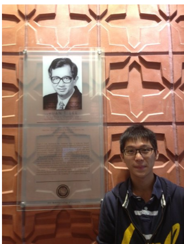
在化學系館與李遠哲先生的照片合影