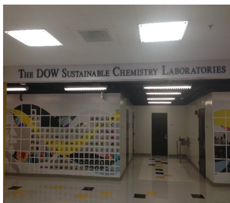
牆上是週期表的實驗室

回到了樓梯的地方，往前走了幾步，發現另一項值得看的地方，是一排停車位，其中有幾個前面是有立牌子的，寫著：Reserved for Nobel Laureate，車位也有用白色的油漆寫著 NL Reserved。原來這是諾貝爾獎得主的專屬停車位！停車位是留給諾貝爾獎得主的，平常是沒有人停，應該說沒有人敢停的。有了這項發現，往後的日子，我們每次經過時都會特別留意是否有大師的車子停在那，想像與大師美麗的邂逅。