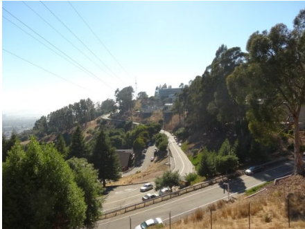
勞倫斯實驗室園區