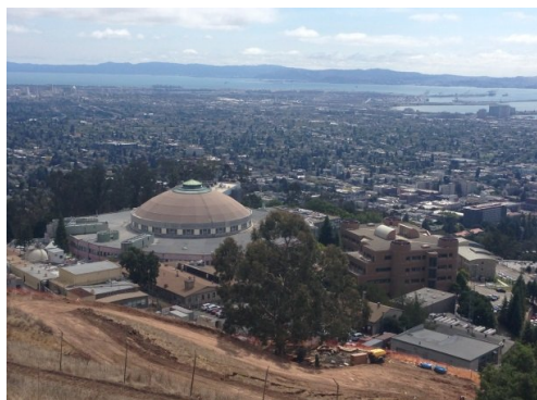
從山上俯瞰勞倫斯實驗室

有了這次的教訓我們更加小心,隨時注意著 Google Maps, 沿著彎曲的人行道往上,來到了一個植物園。稍作休息後就繼續走,走著走著右手邊出現了一個招牌,上面寫著:BERKELEY LAB。招牌後面是一個園區的大門,感覺像是前往實驗室的路,但是對照一下 Google Maps 發現它指示的路還在更前方,所以我們又往前走,經過了一段寬闊明亮的長直上坡,來到一個山頭,可以看到圓頂的那間實驗室。我便從那實驗室的一條路往回搜尋,愈看愈覺得奇怪,那條路的入口居然是我們剛剛經過的大門!看來我們又錯過了...,回到了大門問了警衛才恍然大悟,原來勞倫斯實驗室是一個園區,可能類似台灣的中研院或工研院,顛覆了我以為實驗室是指一棟建築的錯誤想法。而那位警衛說實驗室是只有”裡面的人”才能夠進去的。當時真是無比的唏噓啊,我們只好在大門口拍幾張照留念,好證明我們的確來過勞倫斯實驗室的大門口。不過,我心裡想著,我將來一定有機會成為”裡面的人”。